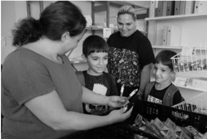
A Strasbourg distribution de matériel scolaire

Haut lieu de la solidarité, la permanence de l'Arc-en-Ciel est ouverte chaque jour de la semaine et propose une vingtaine d'ateliers, qui mettent en avant le « pouvoir d'agir » des personnes accompagnées. Les bénévoles distribuent chaque matin plus de 80 petits-déjeuners aux plus vulnérables, proposent un service de domiciliation postale pour les personnes sans abri ou de l'accompagnement scolaire.