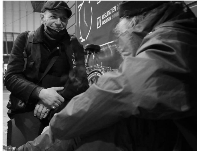
Maraude sociale chaque semaine dans les rues du centre ville de Strasbourg

Les équipes de Caritas accueilleront avec plaisir de nouveaux bénévoles prêts à participer aux projets et à proposer de nouvelles activités solidaires. Renseignements sur www.caritas-alsace.org